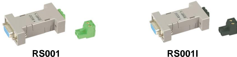
Рис.1 Внешний вид преобразователей интерфейса RS232 в RS485 RS001 и RS001I

Отличительная особенность RS001I – встроенный защитный изолятор на 2,5кВ.